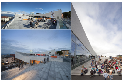
rys.2. Centrum Kultury w Molde, Norwegia, 3XN Architects.

Ponadto, obiekt powstał w strategicznym miejscu. Pierwszy bieg schodów łączy górną i dolną część miasta, co wywołuje naturalny ruch, a duże przeszklenie umożliwia wgląd do środka, zachęca do wejścia i spędzenia tam czasu. Fascynuje mnie zabieg, który zastosowali architekci projektując schody łączące dwie części miasta. Uważam, że to prosty, ale genialny i bardzo efektowny sposób, który wykorzystuje potencjał i unikalne cechy miejsca, nadając jednocześnie obiektowi charakter centro-twórczy. Powoduje, że miejsce to staje się centrum towarzyskim. Budynek zapewnia zarówno profesjonalne warunki dla artystów występujących na festiwalu, jak też spełnia potrzeby mieszkańców na co dzień, umożliwiając im kontakt z kulturą oraz udostępniając przestrzeń do artystycznego wyrazu. Jest przykładem budynku elastycznego, dającego duże możliwości dla odbywających się aktywności.